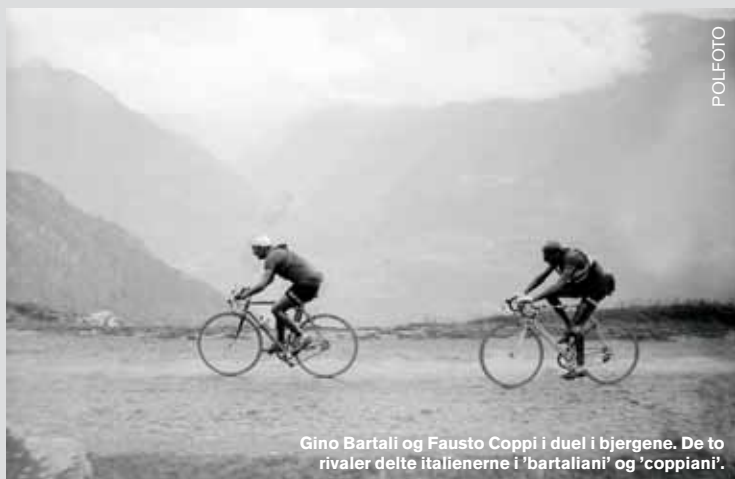
Gino Bartali og Fausto Coppi i duel i bjergene. De to rivaler delte italienerne i 'bartaliani' og 'coppiani'.

nægtede at velsigne Giro d'Italia, fordi Coppi havde skabt skandale ved at forlade sin kone efter en affære med en gift kvinde. Mange troede, at der skete en forbrødring mellem de to ryttere under Tour de France i 1952. På et berømt fotografi deler de tilsyneladende en flaske vand under en bjergetape. Coppi sagde bagefter, at han rakte flasken til Bartali, som dog benægtede at have modtaget noget fra Coppi, og de diskuterede episoden i årevis.