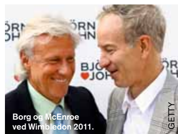
Borg og McEnroe ved Wimbledon 2011.

sig overtale til et sidste tv-interview. Da han bliver utålmodig, smiler han og lægger forsigtigt hænderne på hofterne af den kvindelige reporter, mens kameraet stadig kører. Hun lader sig smigre, og Borg slipper for yderligere spørgsmål.