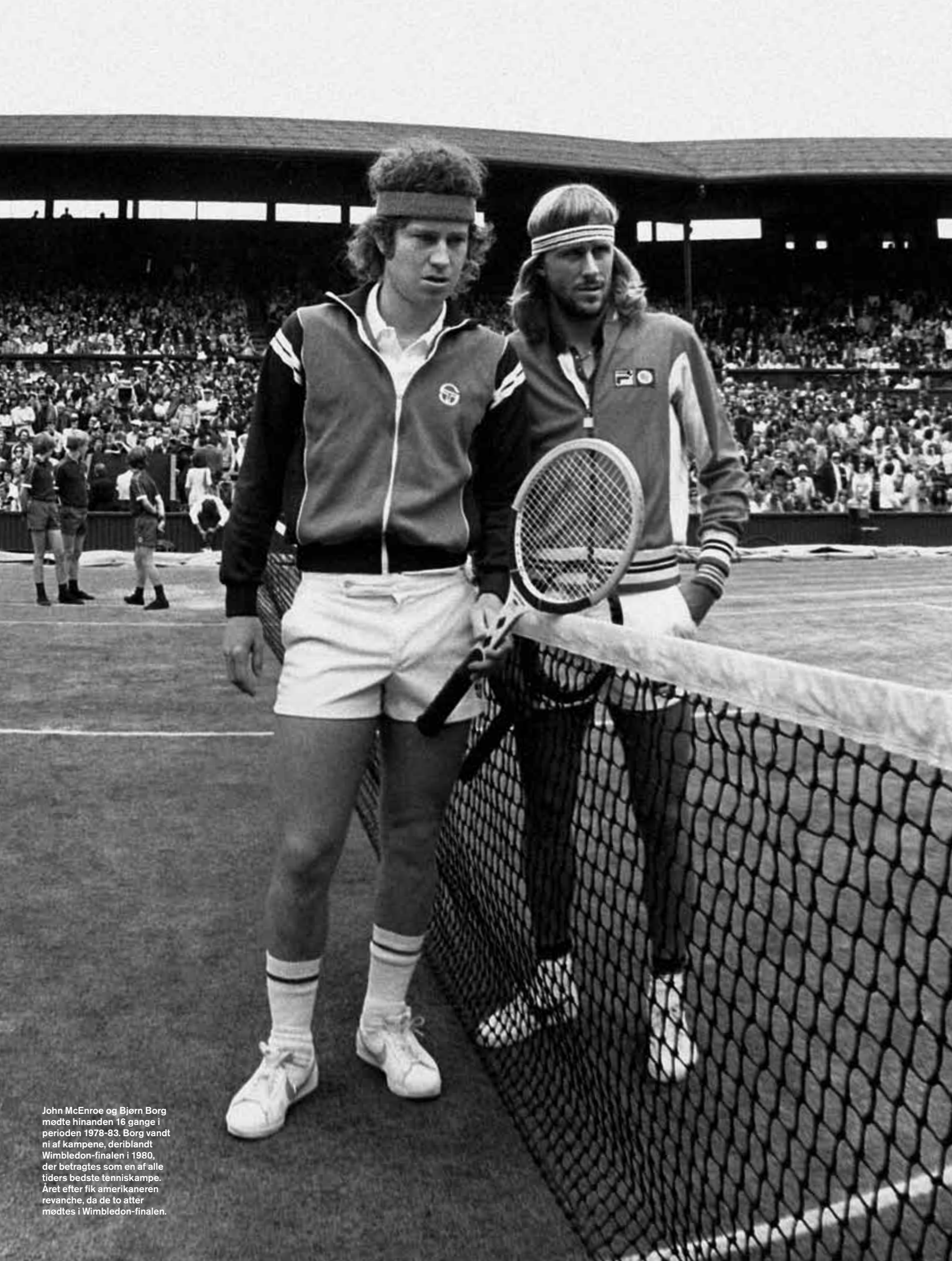
John McEnroe og Björn Borg mødte hinanden 16 gange i perioden 1978-83. Borg vandt ni af kampene, deriblandt Wimbledon-finalen i 1980, der betragtes som en af alle tiders bedste tenniskampe. Året efter fik amerikaneren revanche, da de to atter mødtes i Wimbledon-finalen.