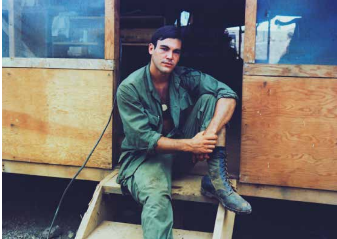
Oliver Stone blev dekoreret to gange for sin indsats i Vietnam. Han modtog både en Bronze Star og et Purple Heart. Førstnævnte for at angribe en vietnamesisk skyttegrav med en granat – en situation, der er skildret i 'Platoon'.