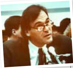
Oliver Stone under høringen i kongressen i 1992.

lavet i den ånd at fortælle sandheden. Filmen førte i 1992 til en høring i kongressen, hvor Oliver Stone var blandt de afhørte, og filmen var medvirkende til en lov, der foreskriver, at alle myndighedernes dokumenter om drabet skal offentliggøres senest 25 år efter vedtagelsen af loven (dvs. i efteråret 2017) – medmindre den siddende præsident modsætter sig det.