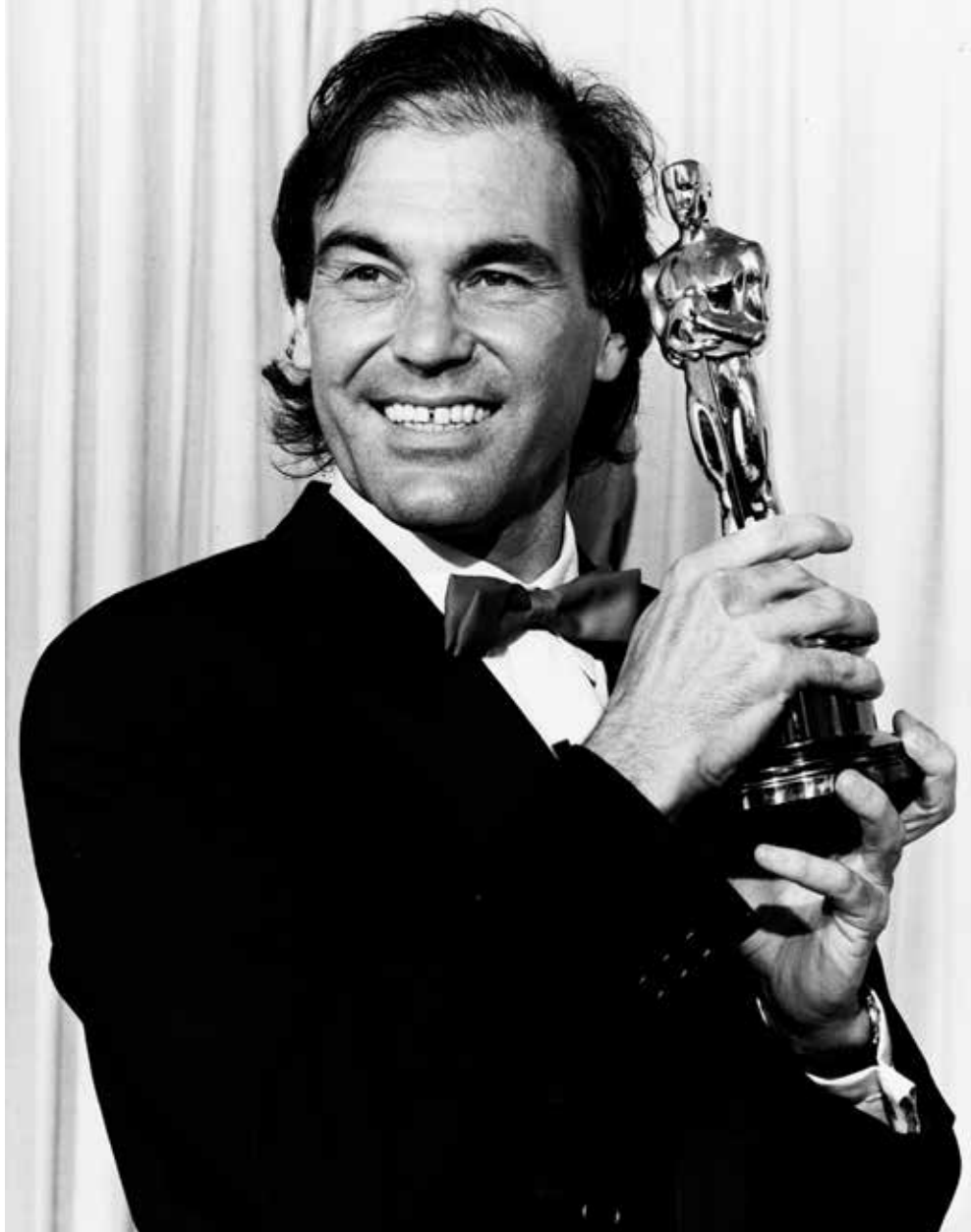
Oliver Stone med sin tredje, og seneste, Oscar i karrieren, som han modtog i 1990 for instruktionen af 'Born on the Fourth of July'.

at det inspirerede til adskillige mord i virkelighedens verden ('Natural Born Killers'), eller at han burde dømmes for krigsforbrydelser pga. den delvis selvbiografiske 'Platoon'. Og nu kommer 'Snowden' om Edward Snowden, som Stone åbenlyst beundrer, mens kritikerne mener, at Snowdens læk af fortroligt materiale har hjulpet terrorister til at undgå overvågning. Igen har filmskaberens taget fat i et betændt emne, og igen har det været svært at finde filmselskaber, der turde finansiere filmen. Stone kalder det for det hårdeste, han har prøvet i branchen, og noget, han ikke har lyst til at opleve igen.