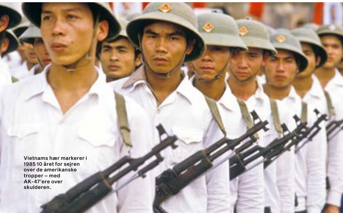
Vietnams hær markerer i 1985 10 året for sejren over de amerikanske tropper – med AK-47'ere over skulderen.

Mikhail Kalashnikov selv håbede, at AK-47 og de andre våben, han skabte, en dag ville blive unødvendige. I 2001 sagde han: "Efter min mening vinder det gode til sidst. Det bliver efter min død, men der kommer en dag, hvor mine våben ikke længere vil være i brug eller nødvendige." ■