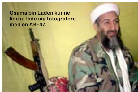
Osama bin Laden kunne lide at lade sig fotografere med en AK-47.