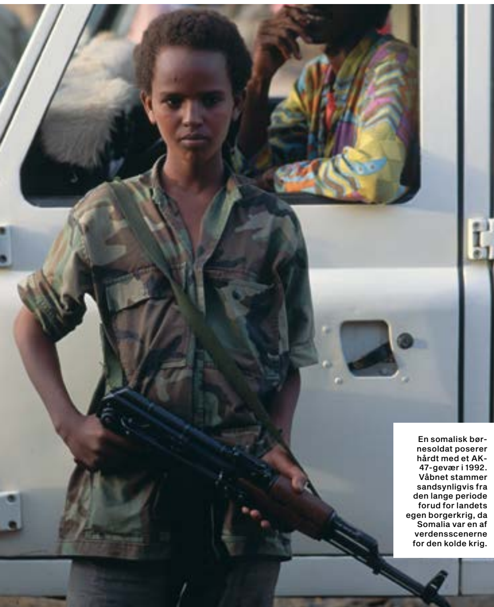
En somalisk børnesoldat poserer hårdt med et AK-47-gevær i 1992. Våbnet stammer sandsynligvis fra den lange periode forud for landets egen borgerkrig, da Somalia var en af verdensscenerne for den kolde krig.

våben. Det er okay ud til 150 eller 200 meter, men det rammer ikke særlig præcist på længere afstand. Til gengæld betyder designet, at den kan tåle slag og tåle at være snavset. Den er meget tilgængelig. Der, hvor Kalashnikov især gjorde det godt, var med hensyn til tilbringningen af ammunition, det vil sige den måde, patronen kommer ind i kammeret. På ethvert halv- eller fuldautomatisk våben er tilbringningen af ammunition meget vigtig og noget, der kan give problemer. Magasinerne skal være rigtig gode. I Vesten bruger vi meget lette magasiner, for at soldaten ikke skal slæbe på så meget. Et AK-47-magasin er meget tungt, men det er solidt bygget, og der er næsten aldrig fejl på det. Selv meget slidte magasiner fungerer fint. Det er godt set med den konstruktion.”