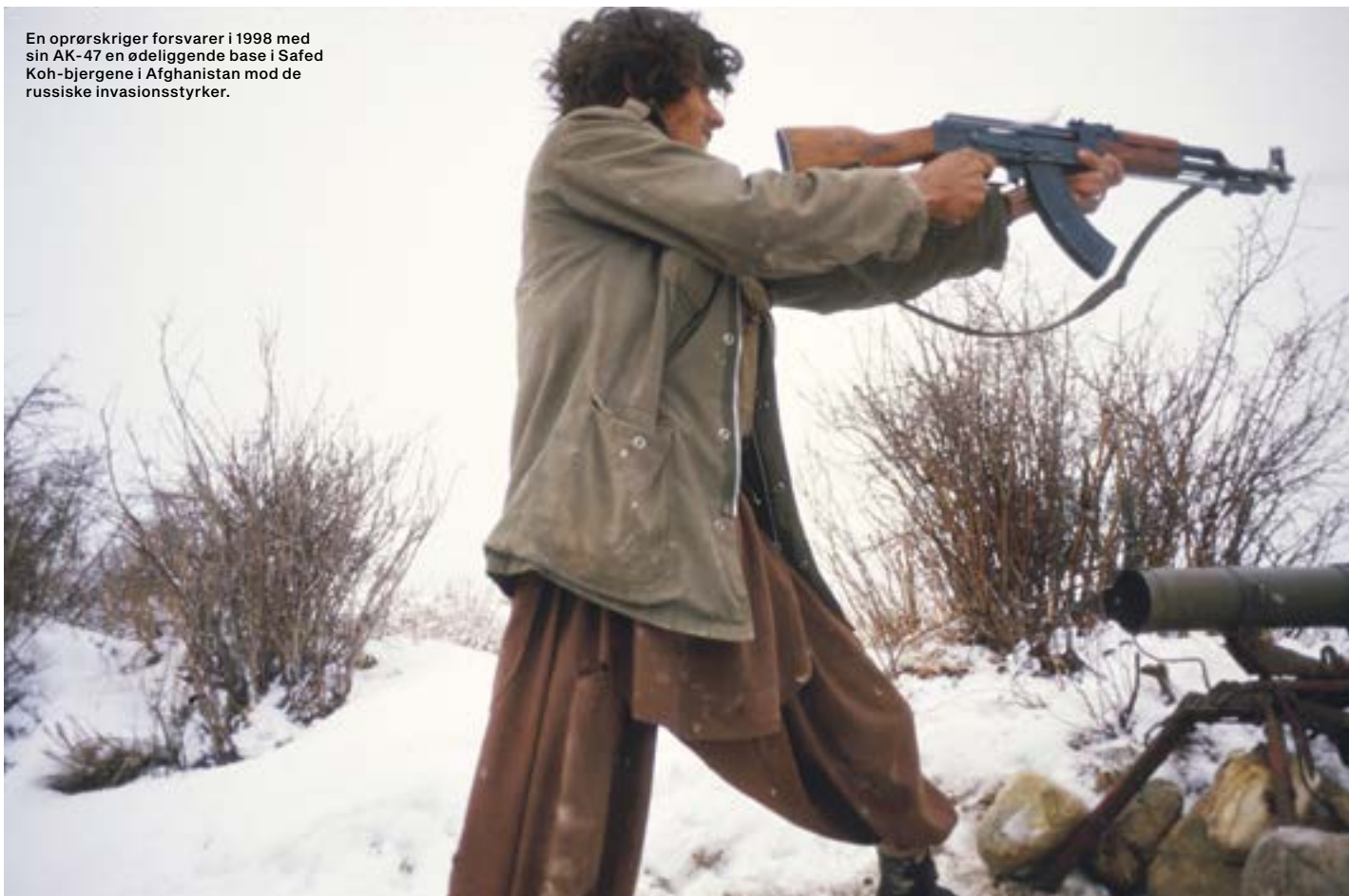
En oprørskriger forsvarer i 1998 med sin AK-47 en ødeliggende base i Safed Koh-bjergene i Afghanistan mod de russiske invasionsstyrker.

næppe forestille sig, hvor stor indflydelse og udbredelse AK-47 ville få fremover, efterhånden som det bredte sig til konflikter over hele verden. Det skulle vise sig at være nærmest uopslideligt, nemt at bruge selv for et barn, og det blev et symbol for terrorister, revolutionshelte, diktatorer, oprørsgrupper og endda i populærkulturen.