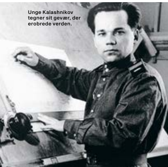
Unge Kalashnikov tegner sit gevær, der erobrede verden.

DET ER HÅNDVÅBNETS SVAR PÅ EN FOLKEVOGN, BÅDE NÅR DET GÆLDER GENKENDELIGHED OG MEKANISK ENKELHED.