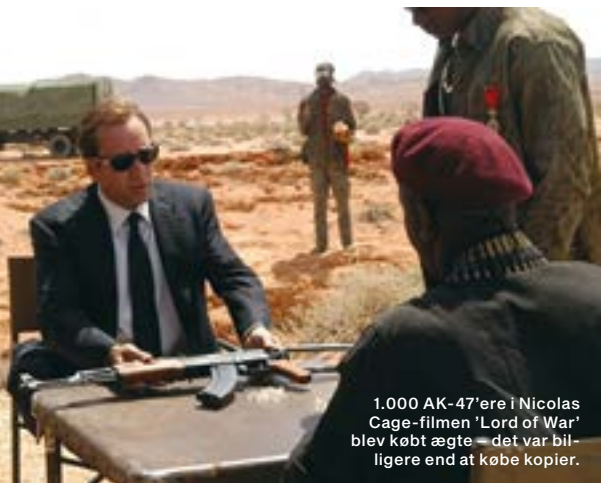
1.000 AK-47'ere i Nicolas Cage-filmen 'Lord of War' blev købt ægte – det var billigere end at købe kopier.

CIA sørgede for, at afghanerne fik flere hundrede tusind Kalashnikov-geværer til kampen mod russerne, der i 1989 måtte opgive at vinde krigen. En stor del af dem endte på det sorte marked i nabolandet Pakistan. Der var så mange eksemplarer, at vestlige medier skrev om en ’Kalashnikov-kultur’ i landet,